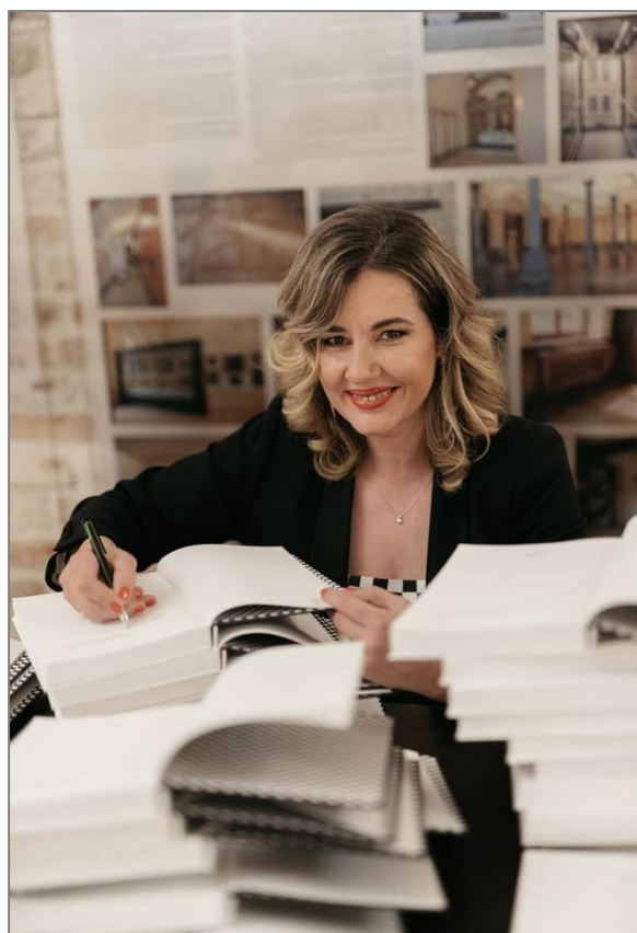
Großmeisterin Dana Reizniece-Ozola

Einst hatte Lettland seinen eigenen Schachkönig - den Weltmeister Mikhail Tal. Jetzt haben wir unsere eigene Schachkönigin - die vierfache lettische Frauenmeisterin und einstige Junioren-Europameisterin Dana Reizniece-Ozola, die jetzt den prestigeträchtigen